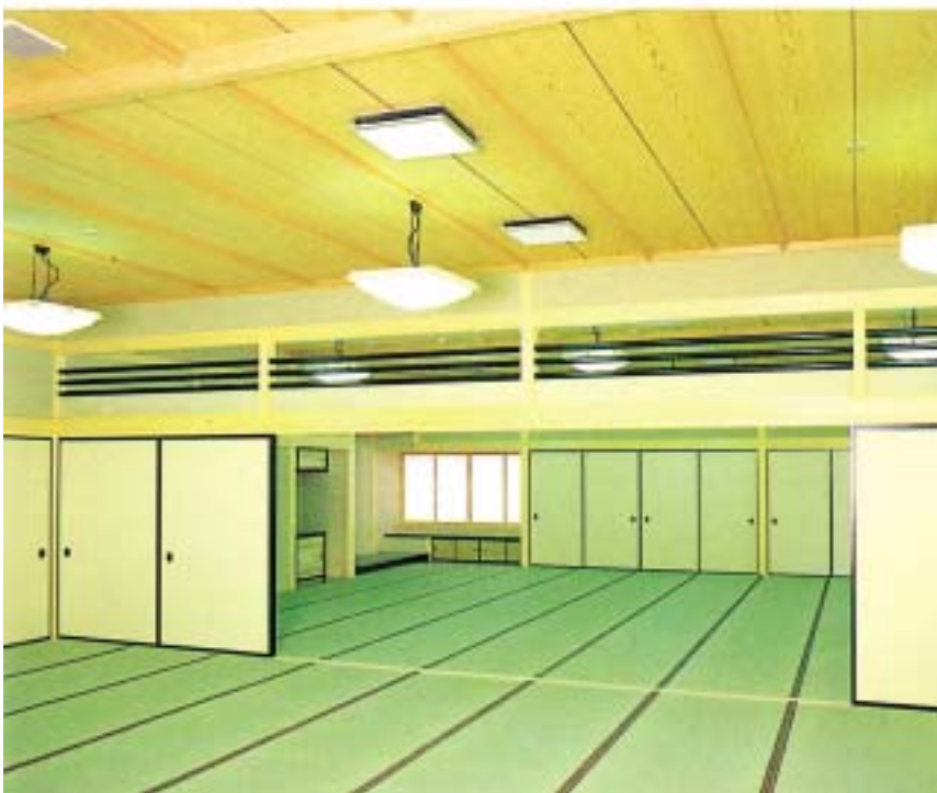
天井板 - 杉中板目使用、造作 - 桧集成材