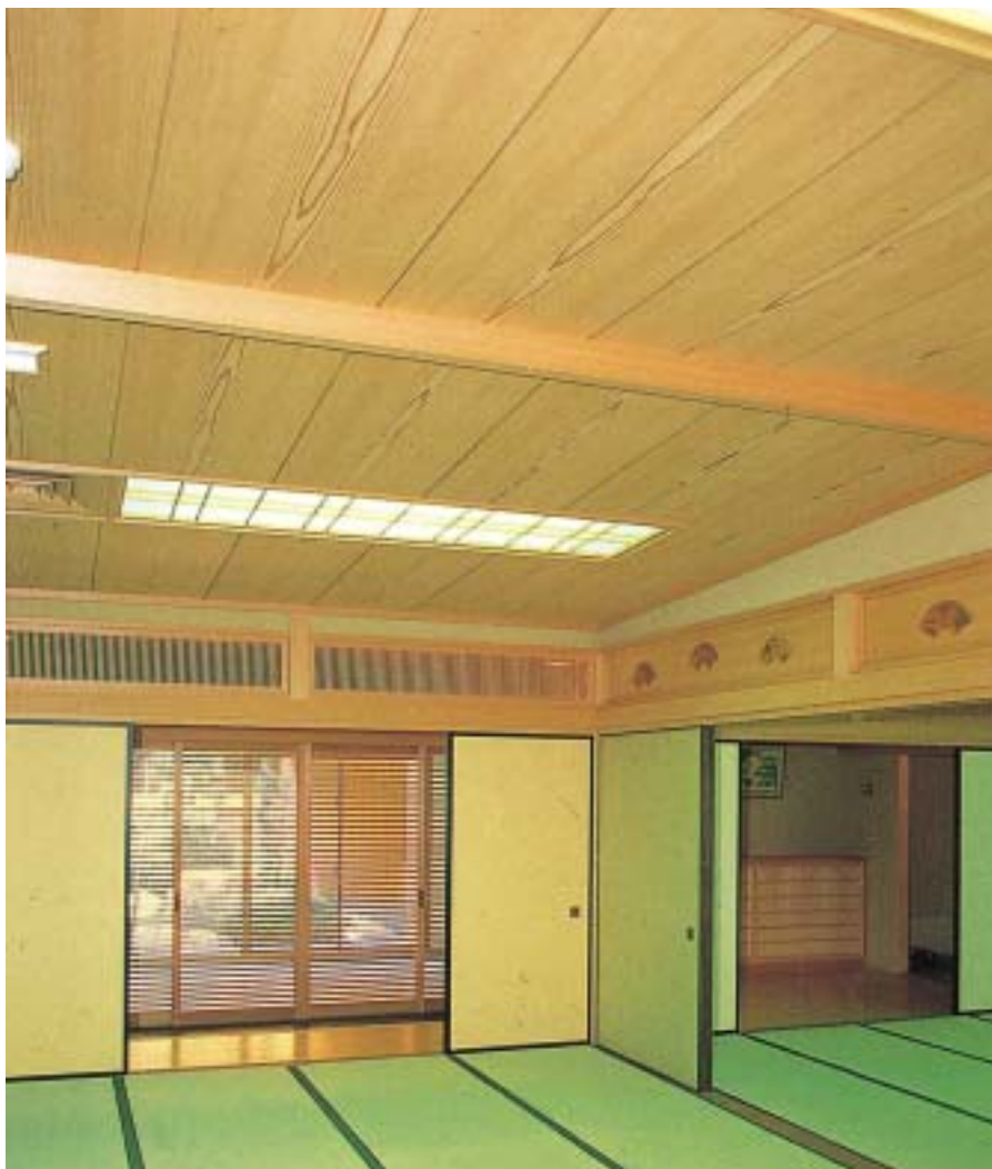
天井板 - 杉中空使用

建築基準法により内装制限(不燃材使用)を受ける内装用天井板、壁面などにご使用頂けます。