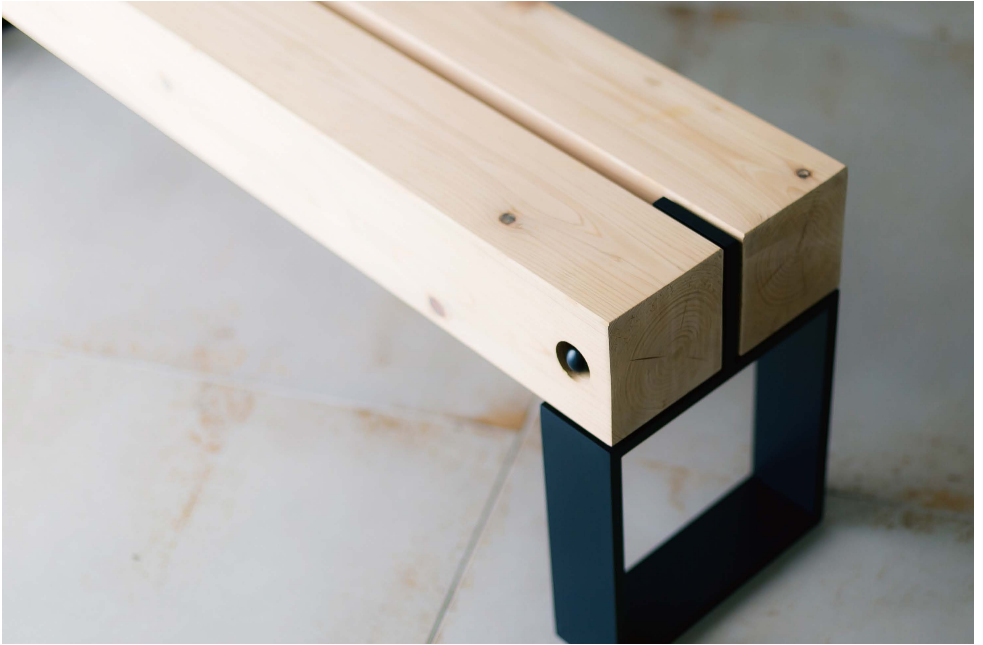
FLAT SQUARE TIMBER BENCH H/5 (Hirochika Aono + Shinichi Shimomura)