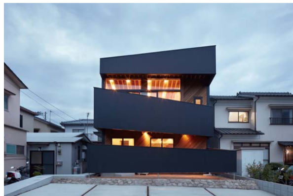
Ke Ha I

木地にシルクのスカーフを木目込んだ小さな騎手と競争馬。馬の名前はタイニススピリッツ。この小さなコンビが今日のレースで大きなことをやっているのだから。使用されているのはチャンパカというモクレン科の木で、日本のホオノキの近縁種である。ホオノキは加工しやすく反りも少ないので、昔から版木、刀の鞘、彫刻材として使われている。