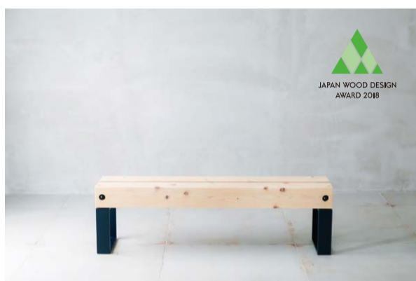
FLAT SQUARE TIMBER BENCH

弊社は九州銘木協同組合として創業し、和室の床の間材を中心に総合銘木卸売を営んでまいりました。近年はライフスタイルの変化に伴い、「床の間」が減少する時代になっております。そのような中、弊社の強みである和室造作を含む木材に関する豊富な知識と多彩な仕入先網、加工塗装工場を活用した自社生産での商品供給で建築家の方々の作品を支えています。時代が変わってもより良いものを創るお手伝いをしていければ幸いです。