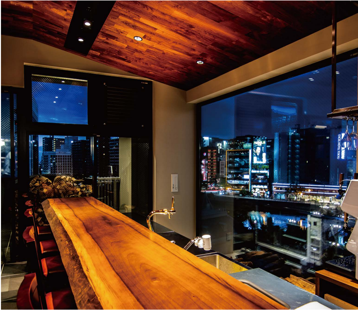
EBISUYA 荻田商業建築デザイン事務所