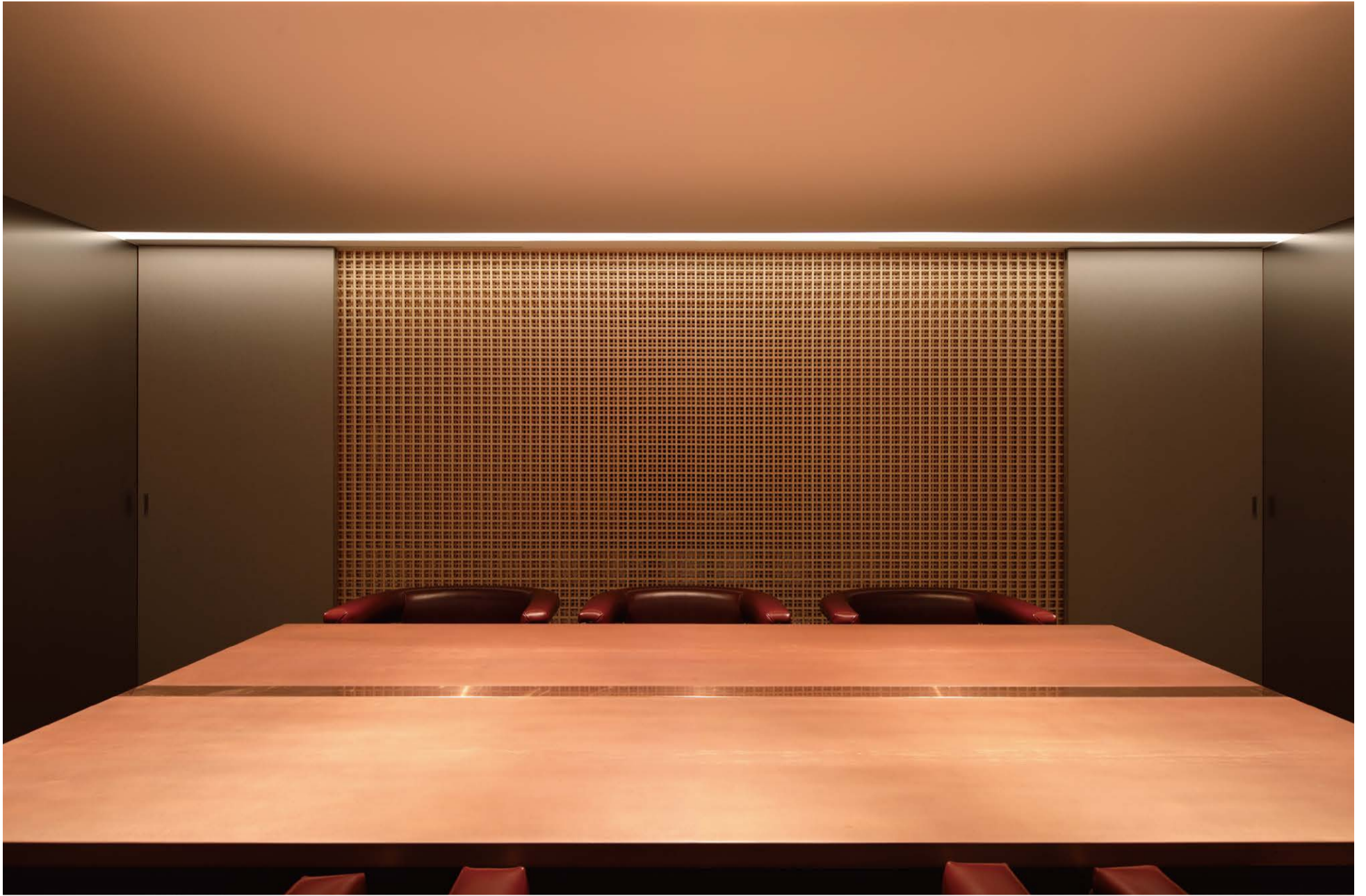
Copperfield アーキタンツ福岡一級建築士事務所 + 九銘協