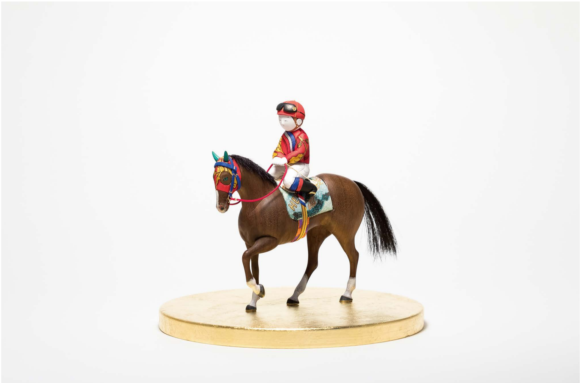
Tiny Spirits 中村弘峰